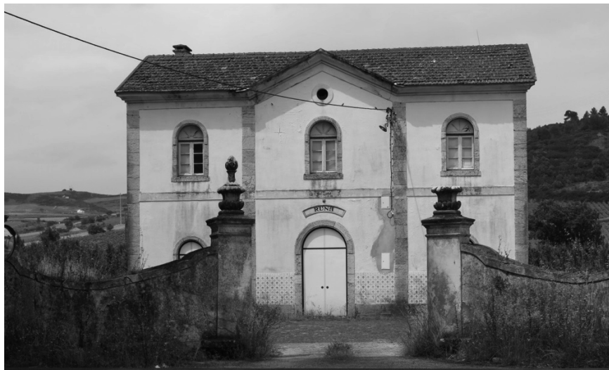
Imagen 5 Estación Runa, en el ferrocarril de Oeste, cerrada al público