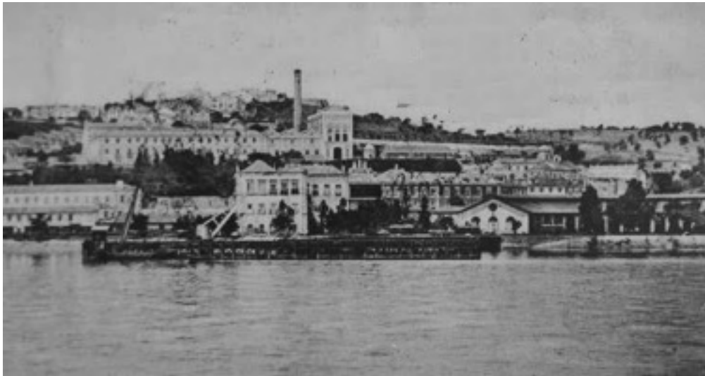
Imagen 1 Puente muelle de Santa Apolonia, Unión Postal Internacional