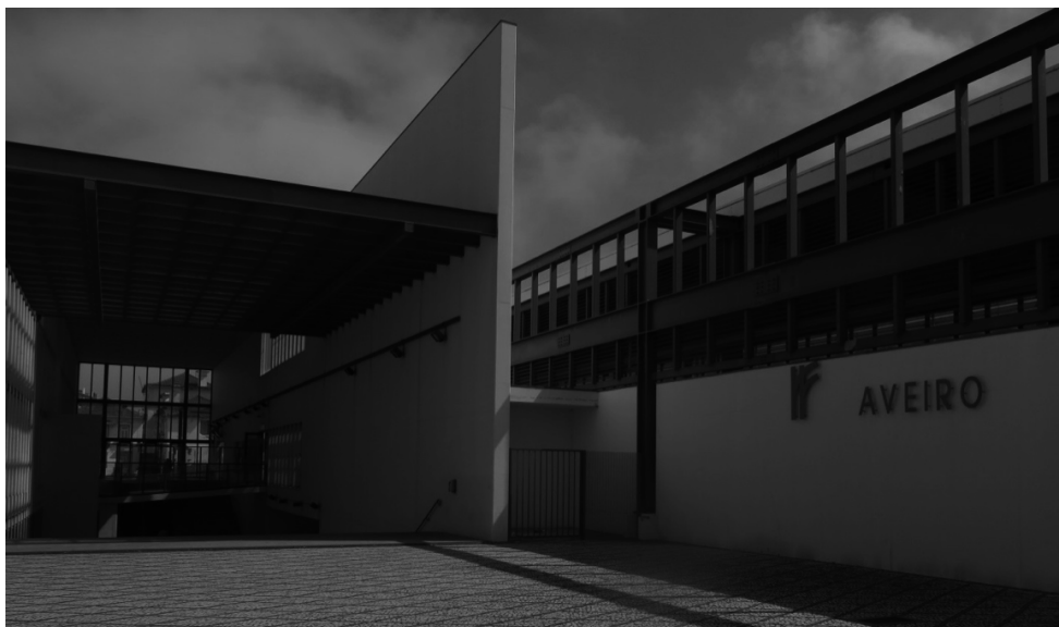
Imagen 6. Nueva estación en Aveiro, en la línea del Norte.