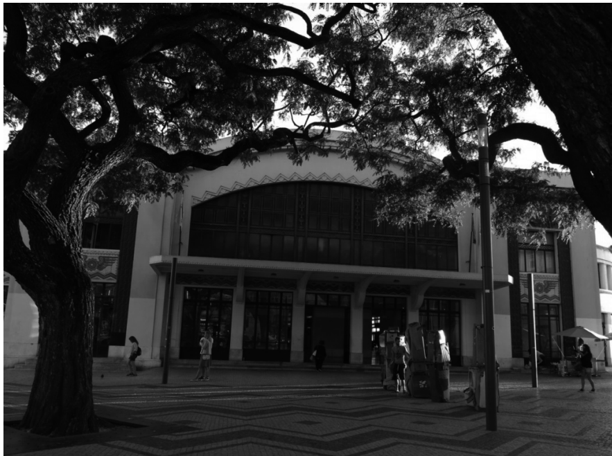
Imagen 4. Estación Cais do Sodré, entrada de la estación de 1928

La línea de Sintra acabó siendo también un fuerte vehículo de sub-urbanización, con su terminal en la estación ferroviaria central del Rossio. Hasta los años sesenta las estaciones ferroviarias desempeñaron un papel central en los nuevos suburbios. Aquí la electrificación se dio a mediados de cincuenta. En cuanto a la línea del Oeste, entrando en el Cacém, a pesar de su potencial en términos de sub-urbanización, fue progresivamente perdiendo importancia.